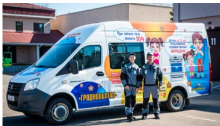
Проект «Автомобиль безопасности»