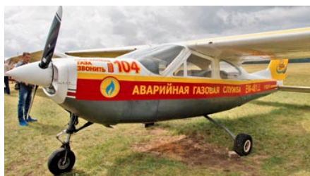
УП «Гроднооблгаз» – участник ежегодного авиационного фестиваля в г. Гродно