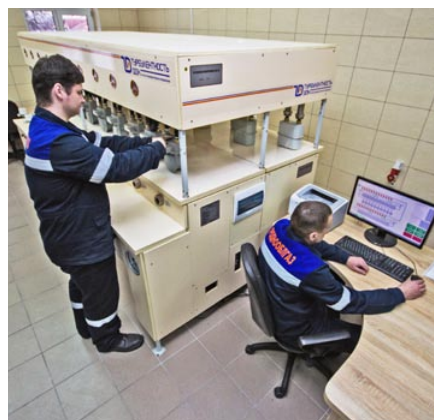
Служба метрологии УП «Гроднооблгаз»