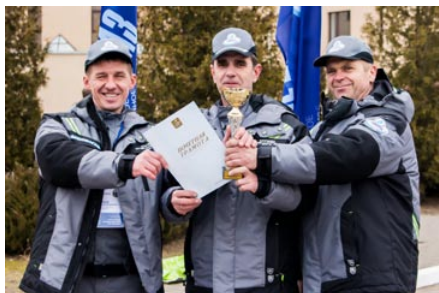
Команда ПУ «Гродногаз» – призер Республиканского смотра-конкурса «Лучшая бригада по обслуживанию ВДГО ГПО «Белтопгаз» 2018 года»