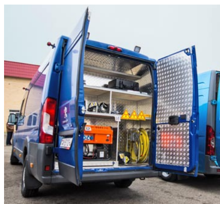
Передвижная мобильная лаборатория контроля качества сварки ПУ «Гродногаз»