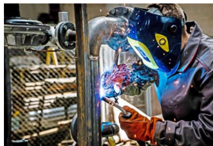
Рабочий процесс в ремонтно-механической мастерской ПУ «Гродногаз»