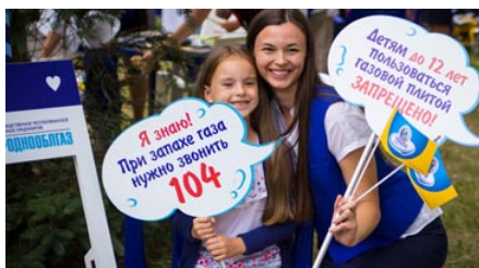
УП «Гроднооблгаз» на XII Республиканском фестивале национальных культур в г. Гродно