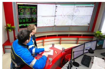
АДС (аварийно-диспетчерская служба) ПУ «Гродногаз»

В январе 2005 года убыточное КУСП «Совхоз «Протасовщина» реорганизовано в форме присоединения к УП «Гроднооблгаз» с созданием филиала «Сельскохозяйственное производственное управление «Протасовщина». Сегодня СПУ «Протасовщина» – прибыльное, динамично развивающееся агропромышленное предприятие, основными видами хозяйственной деятельности которого являются: выращивание зерновых и зернобобовых культур, разведение крупного рогатого скота, молочное хозяйство. По результатам работы за январь-октябрь 2018 года получена прибыль от реализации в сумме 1213 тыс. руб., рентабельность реализованной продукции составила 14,7%, что позволяет занимать лидирующие позиции среди сельскохозяйственных филиалов ГПО «Белтопгаз».