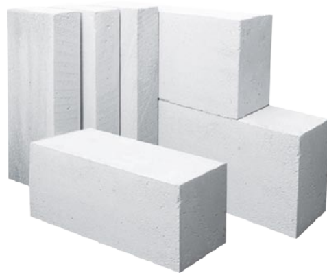
Блоки из ячеистого бетона стеновые