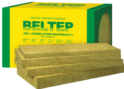
Плиты теплоизоляционные «БЕЛТЕП»

А от имени генерального директора и руководства ОАО «Гомельстройматериалы», от коллектива редакции журнала «Знак Качества» желаем труженикам предприятия, их семьям, родным и близким достатка, благополучия, уверенности в завтрашнем дне. Пусть уходящий год оставит в памяти лишь успешное и доброе, а наступающий – будет годом профессиональных решений и плодотворного труда, укрепит веру в будущее, и рядом всегда будут верные друзья и надежные партнеры. Пусть наступающий год станет для вас годом достижений, добрых перемен, процветания, удач и побед!