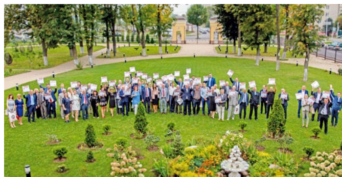
Среди участников конкурса «Лучший строительный продукт года»