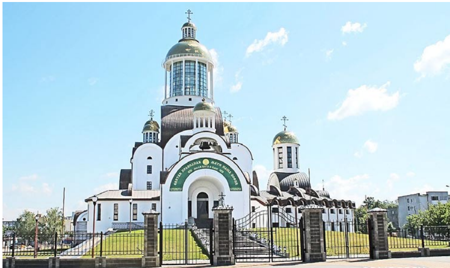
Христорождественский собор, г. Солигорск

кабинета – Почетный диплом, присужденный в свое время коллективу СУ-123 – генподрядчику на строительстве объекта «Средняя школа на 720 мест и детские ясли-сад на 230 мест с бассейном в деревне Боровляны Минского района», представленного в категории «Новое строительство». Все свое мастерство, умение и, можно сказать, душу вложили тогда строители в это оригинальное сооружение, отвечающее самым современным требованиям, которые предъявляются к учреждениям образования. Они тогда сделали все возможное, чтобы школа пришлась по нраву и детям, и учителям. Конечно, над ее возведением трудились многие филиалы стройтреста № 3, но, без сомнения, главный вклад в строительство внесло генподрядное СУ-123.