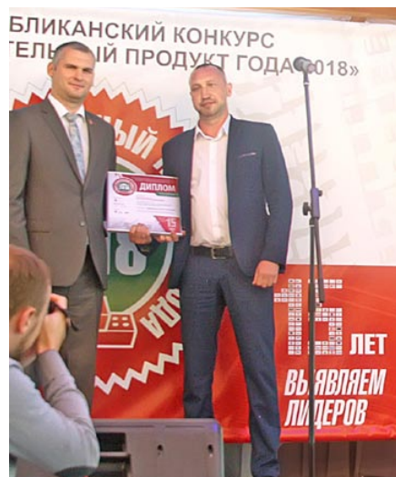
Вручение диплома победителей конкурса «ЛСПГ-2018»

Сегодня СУ-123 – конкурентоспособная организация, располагающая бригадами высококвалифицированных каменщиков, плотников-бетонщиков, кадрами других массовых профессий и инженерно-техническими работниками, способными качественно выполнить работы любой архитектурной сложности. Ее деятельность представлена широким спектром производимых работ, среди которых – комплексное возведение объектов промышленного, сельскохозяйственного, жилищно-общественного, социального, культурно-бытового, коммунального, учебно-образовательного и транспортного назначения, реконструкция объектов промышленного, сельскохозяйственного, жилищно-общественного, социального, культурно-бытового, коммунального, учебно-образовательного и транспортного назначения, капитальный и текущий ремонт объектов промышленного, сельскохозяйственного, жилищно-общественного, социального, культурно-бытового, коммунального, учебно-об-