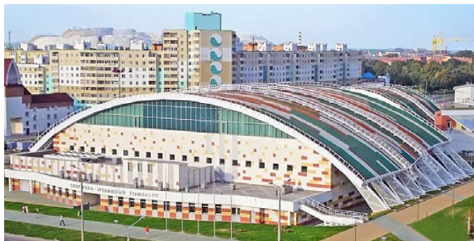
Ледовый дворец, г. Солигорск