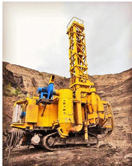
Станок СБШ-250-32 Универсал