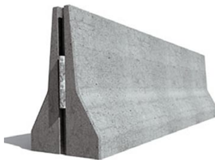
Блок двухстороннего ограждения

Справка. Двухсторонние ограждения предназначены для установки на центральной разделительной полосе автомобильных дорог, городских улицах или дорогах, мостовых сооружениях, в тоннелях и прочих местах, где возможен наезд на ограждение транспортных средств с обеих сторон.