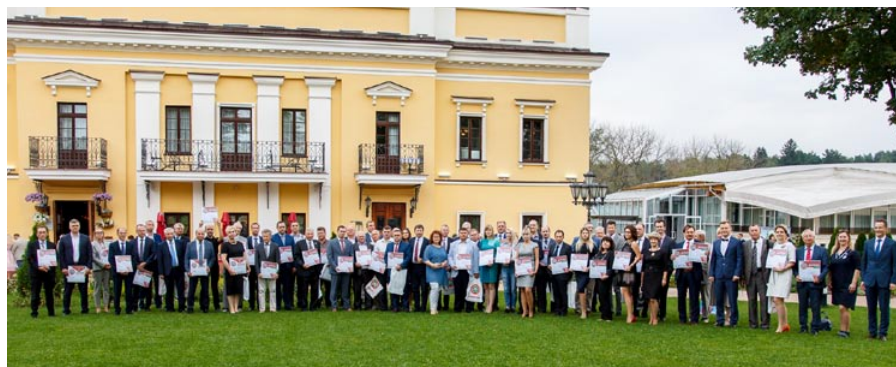
На церемонии награждения в конкурсе «Лучший строительный продукт года»