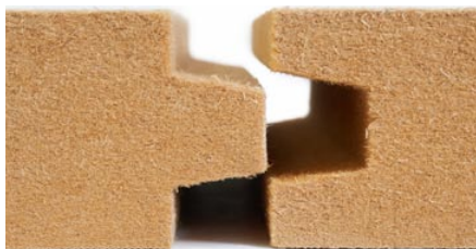
Теплоизоляционные плиты БЕЛТЕРМО

сива древесины и строганого шпона таких пород, как береза, ольха, дуб. В ее производстве используются только экологически чистые материалы, комплектующие и фурнитура поставляются из Словении, Испании, Бельгии, Германии.