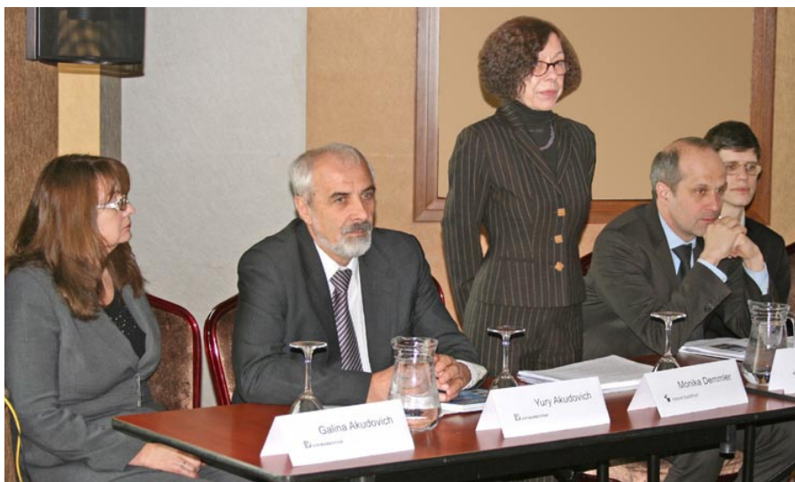
Представители международной выставочной компании Messe Frankfurt

Международный выставочный организатор Messe Frankfurt в сотрудничестве с представительством Messe Frankfurt в Беларуси и странах Балтии SDC LT UAB при поддержке партнера в Беларуси «Экспобизнестур» 4 апреля 2013 года провел презентацию выставок в Отеле Crowne Plaza.